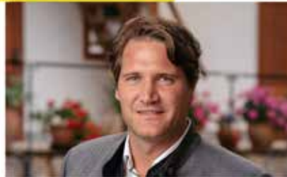
Bürgermeister DI (FH) Andreas Geppert